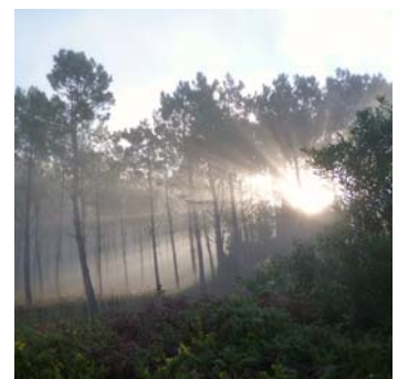
Quelques photos du Caminho Português