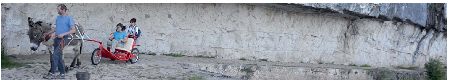
L'Escargoline sur le chemin de halage à Saint-Cirq-Lapopie (46)